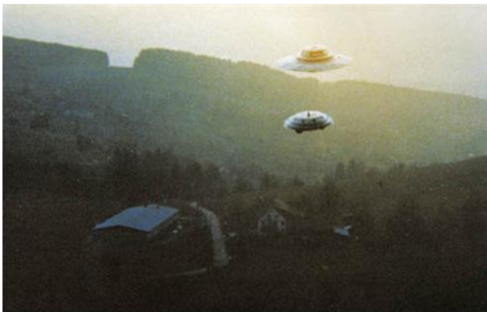
Nr.12: 3. März, 1975; Ober-Zelg Bettswil

Opisani raspored je posmatran i Majer je u stvari napravio fotografije u koloru, na kojima se vide sva četiri broda skupa na nebu, u prekrasnom preletu, kao i dva broda koja odlaze na put kući.