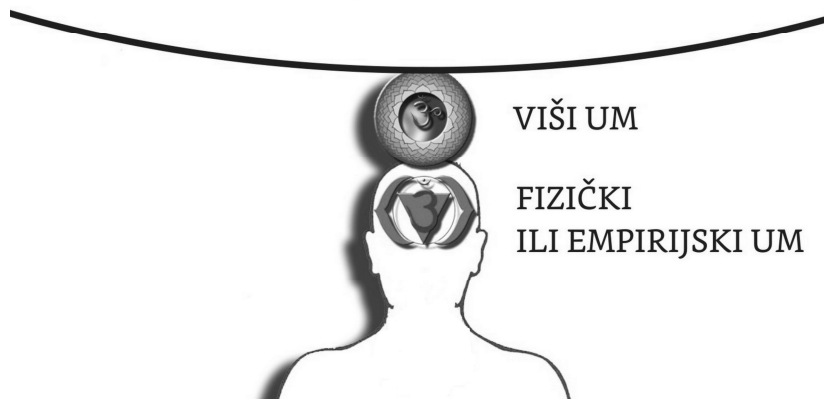
Slika 1. Struktura svesti duše u čoveku

Rekli smo da su svest i postojanje jedno isto, samo se za nas ispoljava kao dvojako, kao postojanje i kao svest o postojanju. Može se takođe reći da se božanski Apsolut ispoljava dvojako, kao samo postojanje (spolja) i kao svest o postojanju unutar čoveka. Svest božanskog Apsoluta, kojom on ispoljava svekoliko postojanje, jeste svest duše. U svom najvišem nivou ona se iz Apsoluta projektuje kao monada svesti koja kreira najveće objekte u kosmosu, zvezde i planete. Monade svesti se progresivno dele u sve manje ogranke dok na kraju ne ostanu najfiniji pojedinačni ogranaci koji su naše individualne duše u našim fizičkim telima. Dakle, naša duša je krajnji ogranak božanske svesti Apsoluta koja sve omogućava. Takođe svest naše duše omogućava svu svest koju imamo i koristimo u svakodnevnom životu. Svakako, svest u telu je samo vrlo mali deo izvorne svesti koja omogućava celu prirodu. U našem telu svest se deli na najniži i najograničeniji deo, onaj koji deluje preko mozga i tela i to je ovde nazvano empirijski, fizički um ili ego. Ta svest je ograničena fizičkim telom i čulima, samo je svesna tela i onoga što opaža