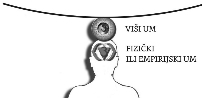
Slika 1. Struktura svesti duše u čoveku