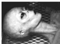
Zeta Reticulae Greys (Sivi)